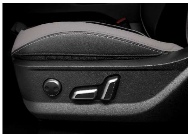
Электржетекпен реттелетін алдыңғы орындықтар