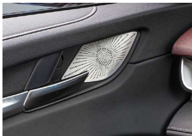
4 жоғары жиілікті динамик, 4 төмен жиілікті динамик