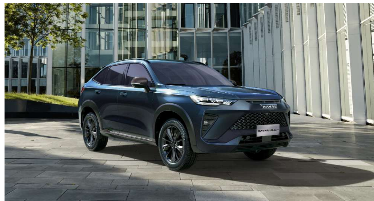
Динамикалық және спорттық шанақ дизайны Шатырдың қиғаш сызығы