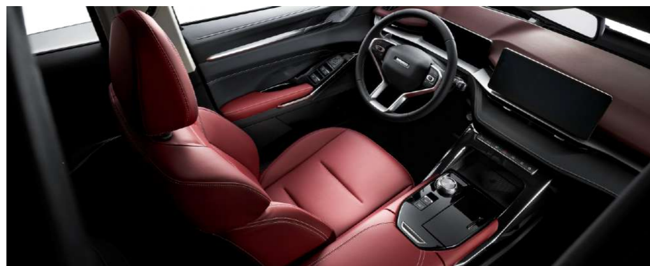
Алдыңғы орындықтарды жылыту және желдету жүйесі