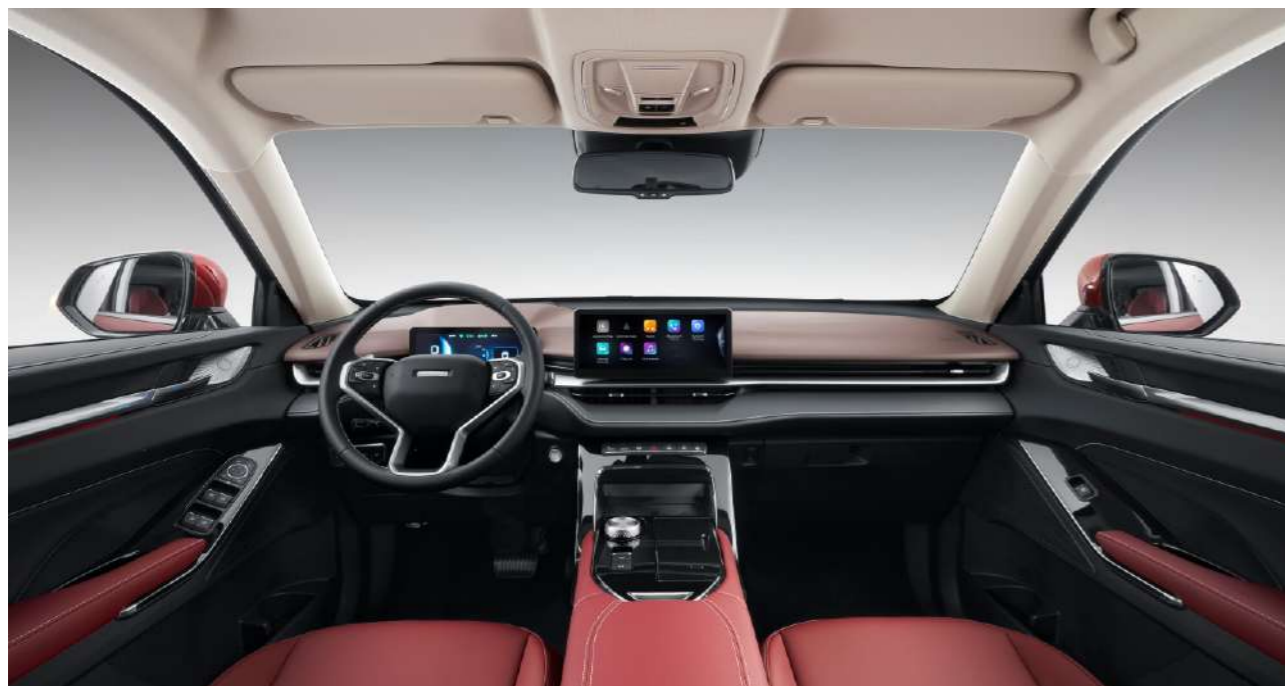
Комфортный и интуитивный дизайн салона