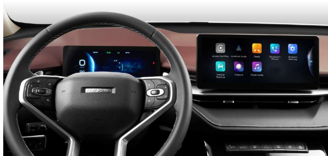
Сенсор дисплейі бар 12,3" мультимедиа жүйесі Apple Airplay және Android Auto қолдауы