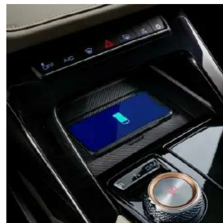
Сымсыз зарядтау жүйесі